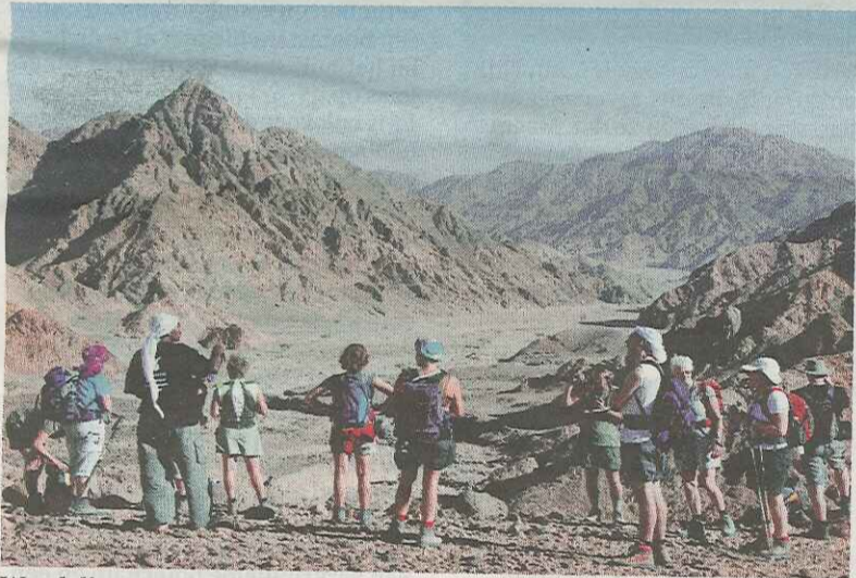
Wandeling met gids door een wadi.

Op de rotswanden van Wadi Maghara zijn vele oud-Egyptische inscripties te vinden. De beroemdste is de inscriptie van farao Sechemchet, die regeerde van 2648 tot 2640 voor Christus. De inscriptie toont hoe de farao de buitenlanders verslaat en is van groot historisch belang omdat hij aantoont dat de Egyptenaren al vanaf de derde dynastie naar de Sinai trokken om mineralen te delven. Vlakbij de inscriptie bevinden zich ook faro'nische turkooismijnen. Deze zijn volledig uitgeput, maar wie tijd en energie heeft om enkele uren door het gruis te snuffelen kan minuscule stukjes turkoois vinden.