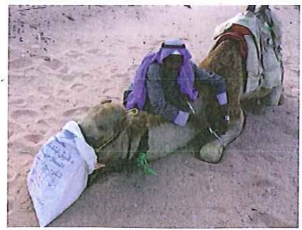
Kameel voeren en vastzetten voor de nacht

Het pasje is niet hoog, zo'n 150 meter, maar het pad is smal en rotsig. Tot mijn verbazing stijgen we niet af maar praten we de kamelen er al rijdend overheen. En dat valt af en toe niet mee want steile paden vinden ze eng. Opeens willen ze dan niet verder en gaan klaaglijk roepen. Aan ons de taak om ze aan te moedigen. Als de voorste weer eens beweegt, betekent dat nog niet dat de achterste ook weer moed vat. Ik heb er spijt van dat ik ben blijven zitten maar de kameel hier laten knielen is geen optie. Dus even slikken maar en met een 'arriehhh, toe maar manneke', proberen de boel in beweging te krijgen.